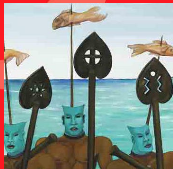
Edouard Duval-Carrié, détail