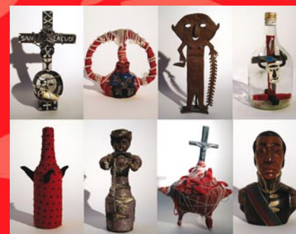
Collection Edouard Duval-Carrié